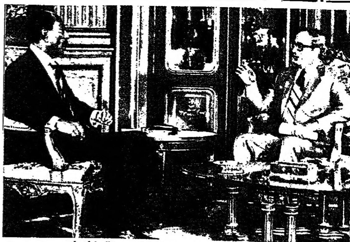
جولة المحادثات الاولى بين الرئيسين ناسون والسادات قسي قصر عابدين